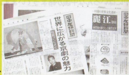
★毎月3回発行の日中友好新聞★